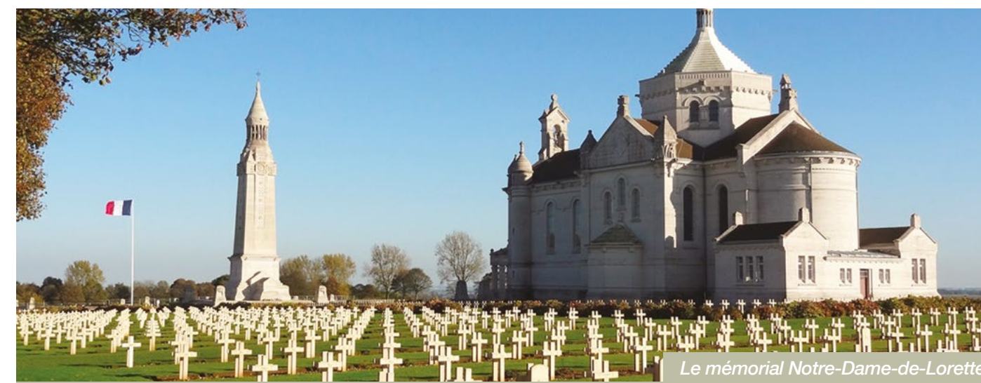
Le mémorial Notre-Dame-de-Lorette

Quand les troupes allemandes atteignent le plateau de Lorette, le 5 octobre 1914, nul ne sait alors qu'il faudra non moins de huit mois pour leur reprendre ce lieu stratégique. Les combats s'y révéleront tellement sauvages et meurtriers qu'on le surnommera bientôt la «colline aux 100 000 morts».