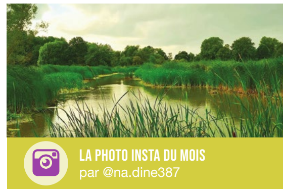
LA PHOTO INSTA DU MOIS par @na.dine387