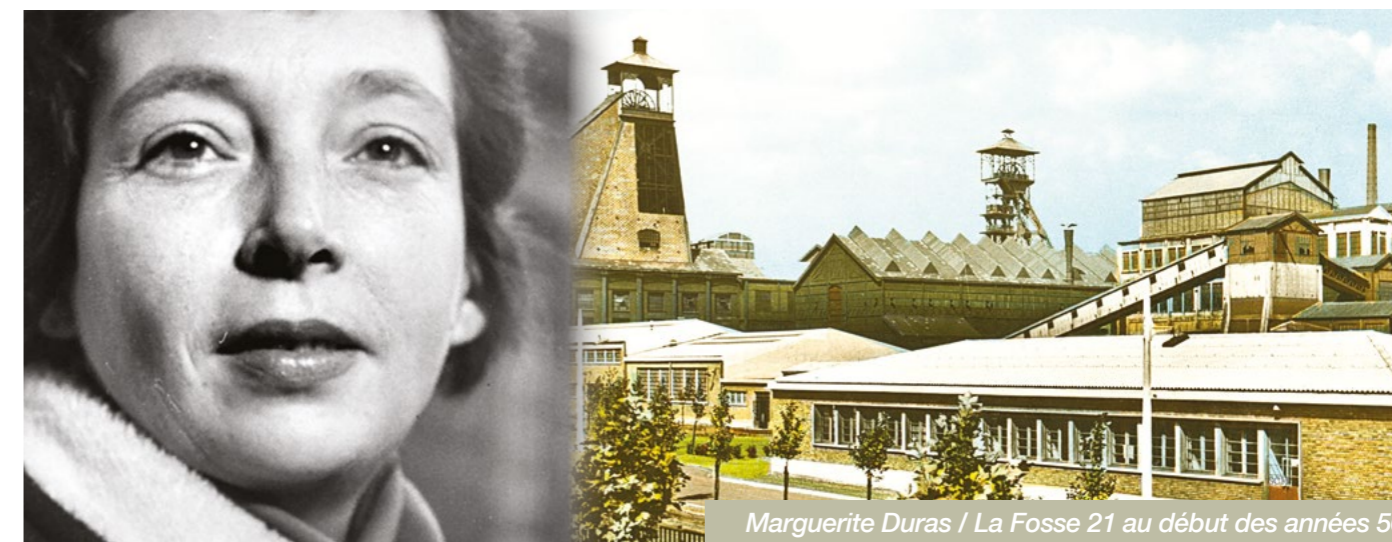
Marguerite Duras / La Fosse 21 au début des années 50