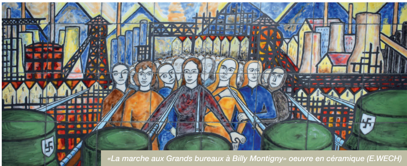
«La marche aux Grands bureaux à Billy Montigny» oeuvre en céramique (E.WECH)

En 1941, Harnes et le Bassin minier se trouvaient sous la férule directe de l'armée Allemande du secteur de Bruxelles. Une raison évidente : le charbon valait de l'or pour l'occupant, ses transports et ses usines d'armement... Ainsi, les mineurs étaient pressurés à qui mieux mieux, travaillant davantage sans profiter du système de ravitaillement français. Les épouses, pour leur part, ne parvenaient plus à faire bouillir tant la marmite de la cuisine que le baquet où se lavait leur mari et, au fond, le briquet se faisait bien léger.