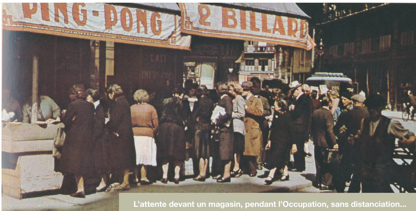
L'attente devant un magasin, pendant l'Occupation, sans distanciation...

Après leur brutale invasion en mai 1940, les Allemands se déploient et édictent leurs règles faites d'interdits : dans les lieux occupés, aucun rassemblement sur la voie publique n'est toléré et toute circulation après 22 heures est proscrite.