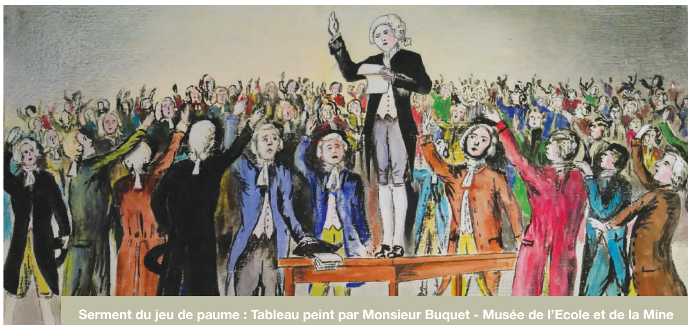
Serment du jeu de paume : Tableau peint par Monsieur Buquet - Musée de l'Ecole et de la Mine

La complexité de la laborieuse procédure qui a présidé à l'organisation de la première élection municipale dans notre commune a suscité l'attention des Amis du Vieil Harnes qui vont tenter de l'expliquer.