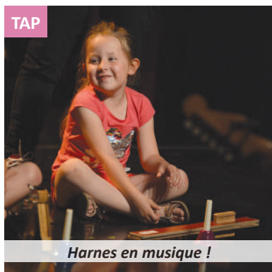
Harnes en musique !

D écidément, le mois de juin aura laissé de nombreux mélomanes en émoi ! Entre la fanfare humoristique de « Pianistologie » (cf. p.4) et les spectacles offerts au sein de la résidence A.-Croizat, il manquait une pointe de jeunesse à cet éco-système musical. Dans nos écoles ou lors des T.A.P., les enfants se sont, eux aussi, essayés à la musique.