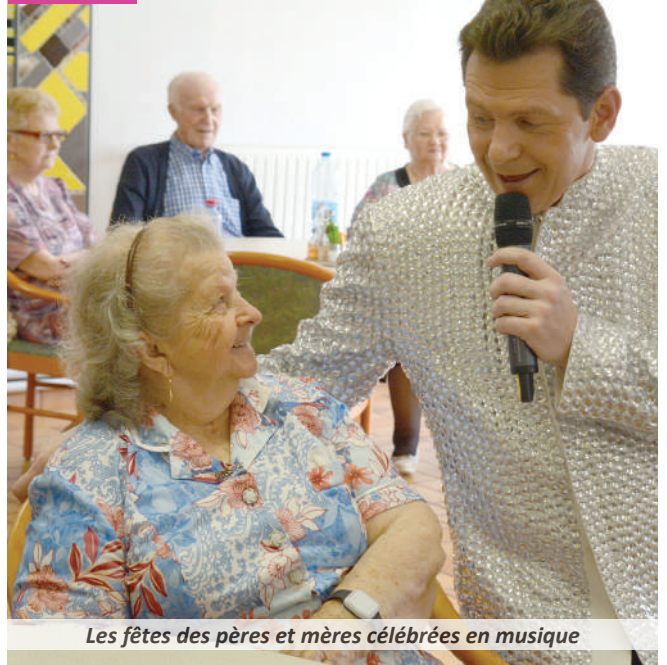
Les fêtes des pères et mères célébrées en musique