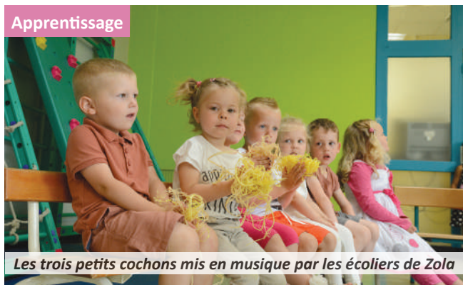
Les trois petits cochons mis en musique par les écoliers de Zola