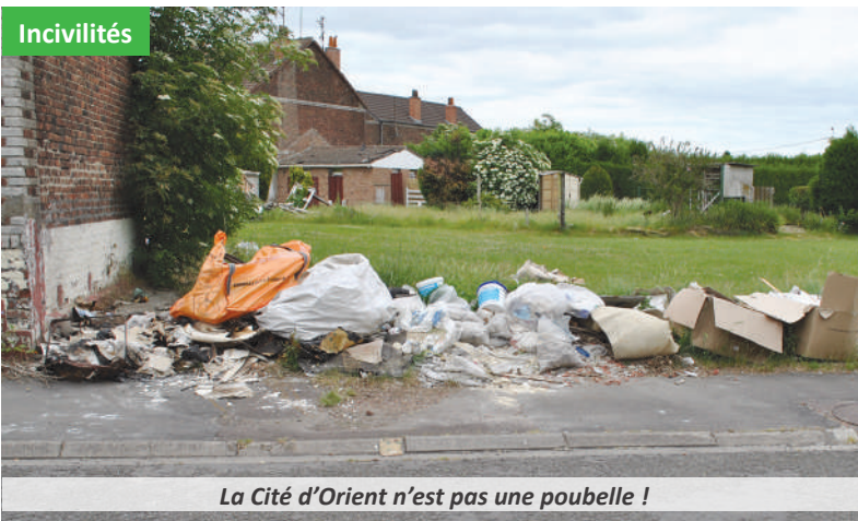
La Cité d'Orient n'est pas une poubelle !