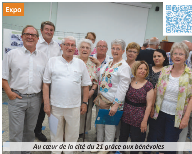
Au cœur de la cité du 21 grâce aux bénévoles

Et bien d'autres choses encore... Une cité en reconquête de la nature grâce à la Coulée Verte... Une cité qui ne demande qu'à s'ouvrir aux autres.