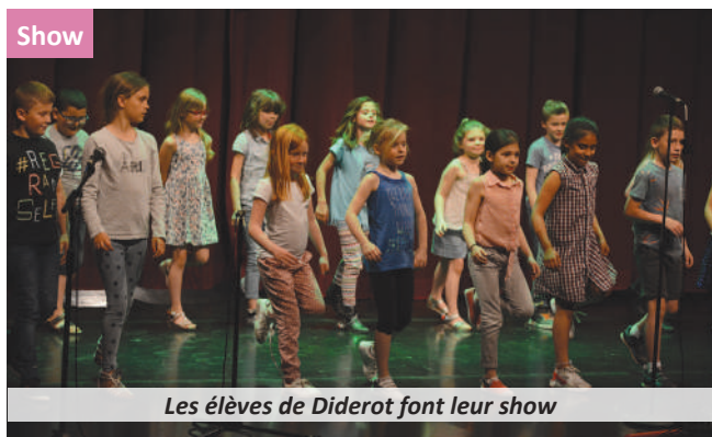
Les élèves de Diderot font leur show