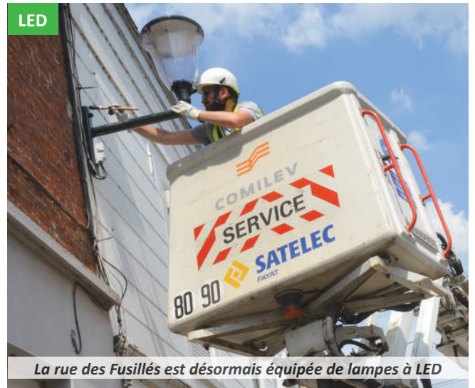
La rue des Fusillés est désormais équipée de lampes à LED

Offrant un large confort de luminosité la nuit, cette solution permet un gain écologique et économique pour la commune, avec 70% d'énergie renouvelable. C'est pourquoi, début juin, l'entreprise Satelec est intervenue dans la rue des Fusillés afin de procéder au remplacement des ampoules. Au total, pas moins de 40 lanternes ont subi une cure de jeunesse durable.