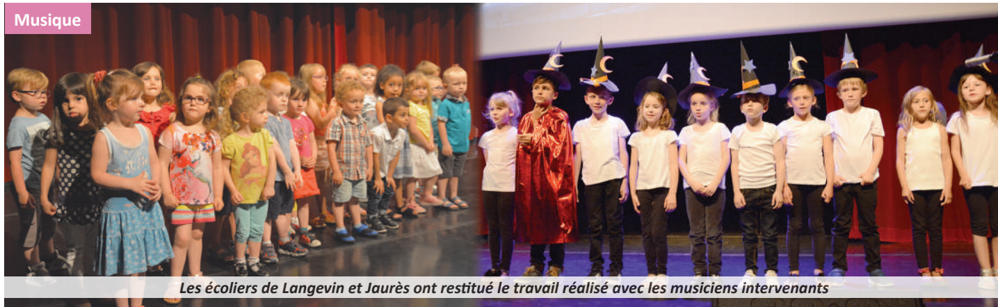
Les écoliers de Langevin et Jaurès ont restitué le travail réalisé avec les musiciens intervenants