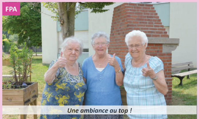
Une ambiance au top !

blissement et de louer un logement d'accueil, en pension complète, afin d'apprécier la vie en communauté et tous les plaisirs qu'elle procure.