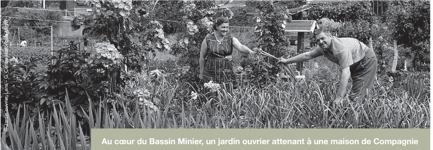
Au cœur du Bassin Minier, un jardin ouvrier attendant à une maison de Compagnie