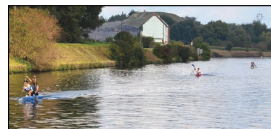
Canal de la Souchez lors des 1000 pagaies

térêt général, tant pour le territoire que les habitants, avec cette volonté de redonner à cette voie d'eau une fonction récréative.