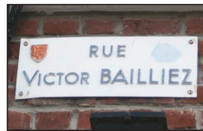
A Harnes, une rue porte le nom de Victor Bailliez