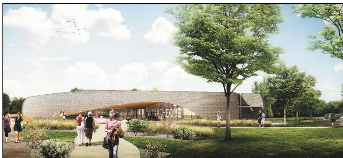
Perspective du projet de médiathèque

Ce nouvel espace, ouvert à tous, par les différents équipements qui le composent, présente une complémentarité des services, dans tous les domaines : citoyen avec la Maison des Initiatives Citoyennes (MIC), social avec le CCAS, sportif avec le complexe, culturel avec la future