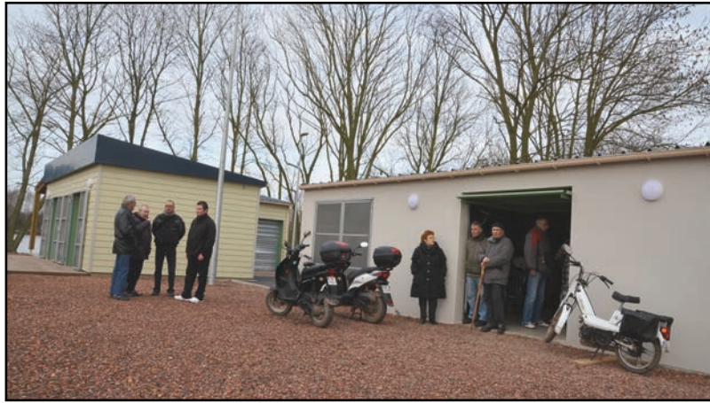
Remise des clés du nouveau local du Brochet Harnésien

Première infrastructure côté harnésien, les 350 pêcheurs du Brochet Harnésien se sont vus remettre les clés de leur nouveau local, ce dimanche 23 février. Sa configuration consiste en deux bâtiments distincts : l'un à vocation davantage technique ; l'autre, destiné à la vie collective. La passerelle du centre-ville, qui menaçait de s'effondrer suite à un effacement de terrain, a été démolie. Une association, « Le renouveau de la passerelle du Bois de Florimond », a été ensuite créée afin de rechercher et collecter des fonds publics et privés, dans l'objectif du remplacement de cette passerelle piétonnière et cavalière menant dans cet espace vert et boisé. Enfin, quant à celle du Brochet Harnésien, fermée depuis 2007, elle sera réhabilitée par la Communauté d'Agglomération de Lens-Liévin, dans le cadre de la réfection de la boucle 18.