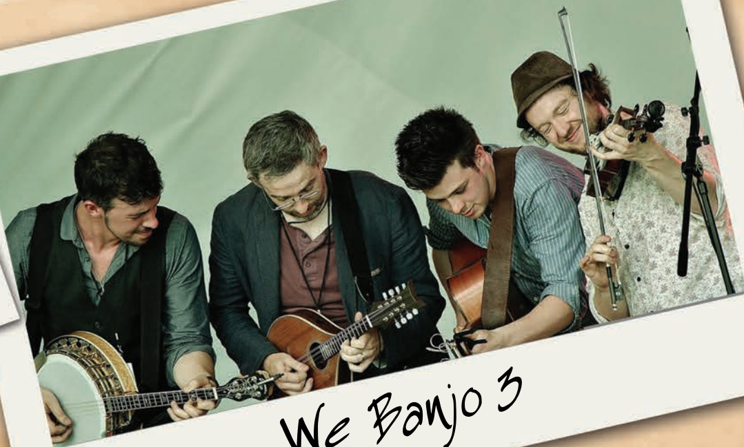
We Banjo 3

Renseignements : Centre Culturel au 03 21 76 21 09 ou jacques.prevert@ville-harnes.fr