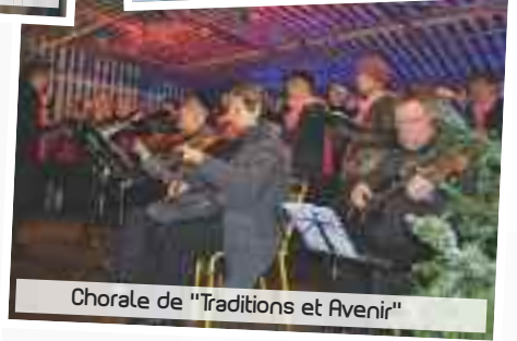
Chorale de "Traditions et Avenir"