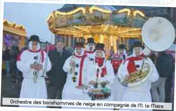
Orchestre des bonshommes de neige en compagnie de M. Le Maire