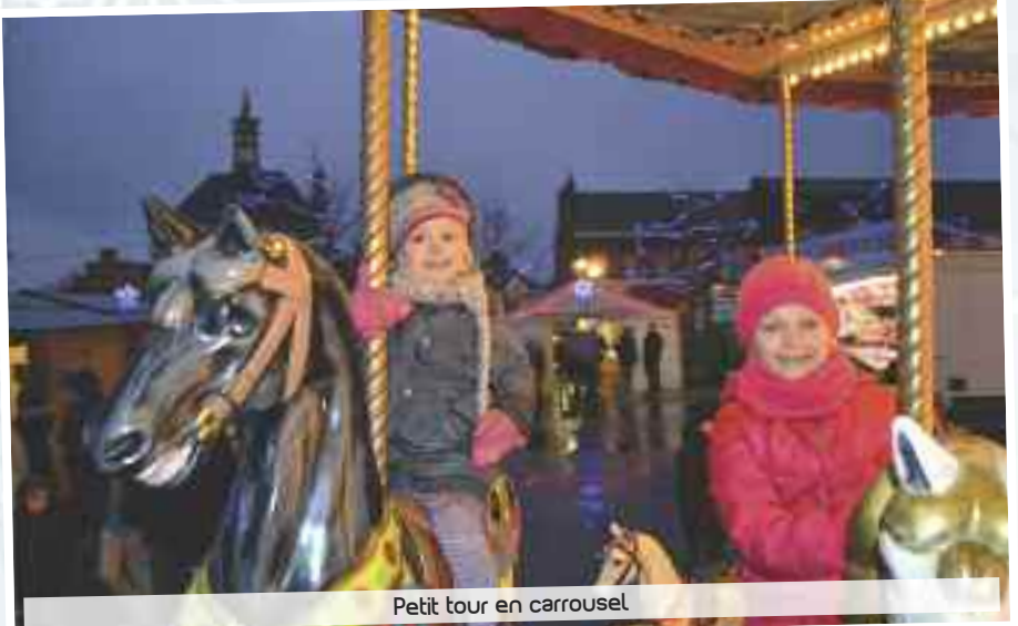
Petit tour en carrousel