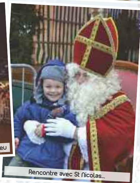
Rencontre avec St Nicolas...