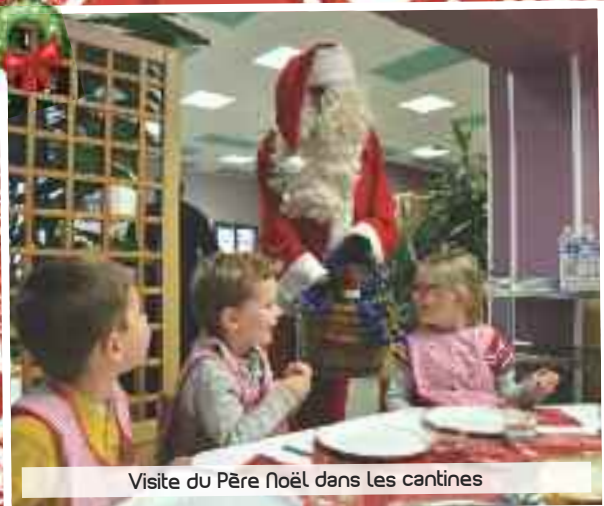
Visite du Père Noël dans les cantines