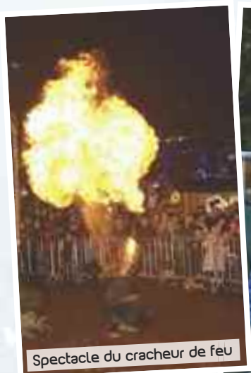
Spectacle du cracheur de feu