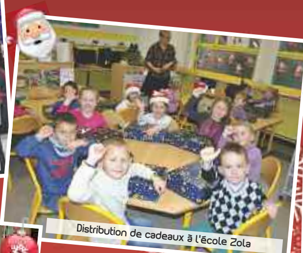
Distribution de cadeaux à l'école Zola