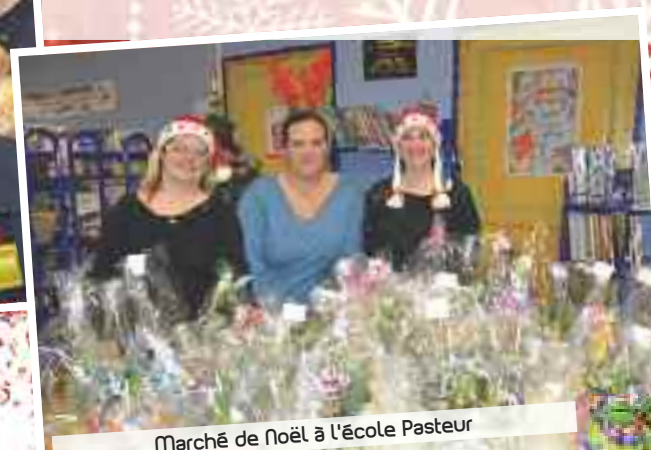
Marché de Noël à l'école Pasteur