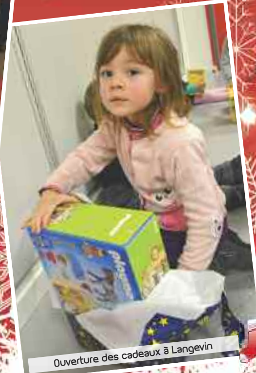
Ouverture des cadeaux à Langevin