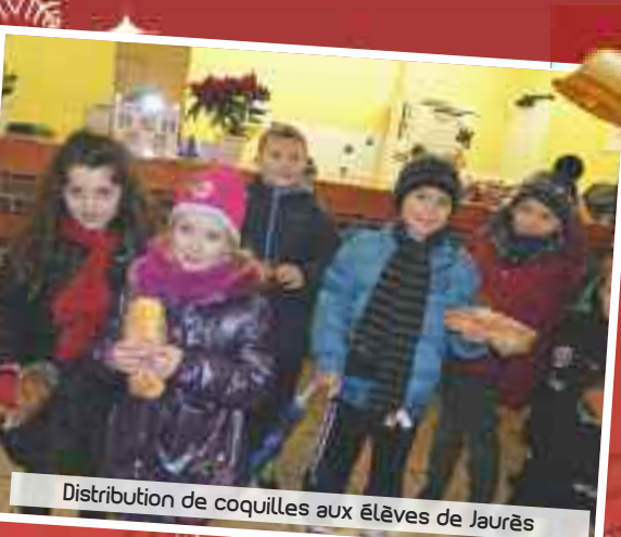
Distribution de coquilles aux élèves de Jaurès