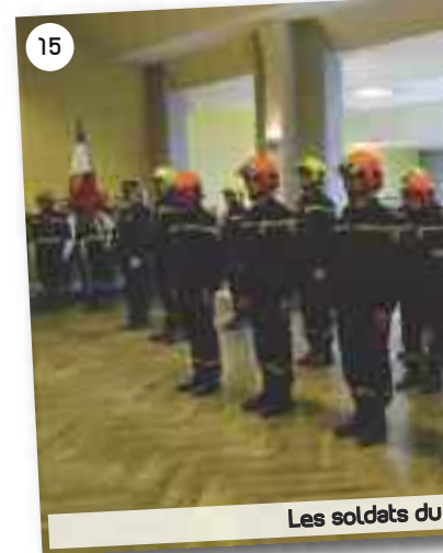
Les soldats du