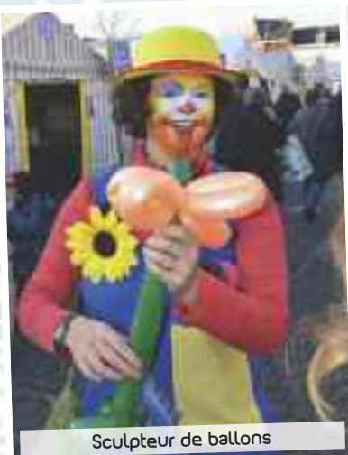
Sculpteur de ballons

Le Marché de Saint-Nicolas est, à n'en pas douter, un des événements forts du premier week-end de décembre, l'un de ceux très attendus des Harnésiens, et très convoités des extérieurs ! L'édition 2014 a, comme les précédentes, connu le succès espéré par les organisateurs et les partenaires. Trois jours durant, la magie de Noël a opéré au cœur de notre commune.