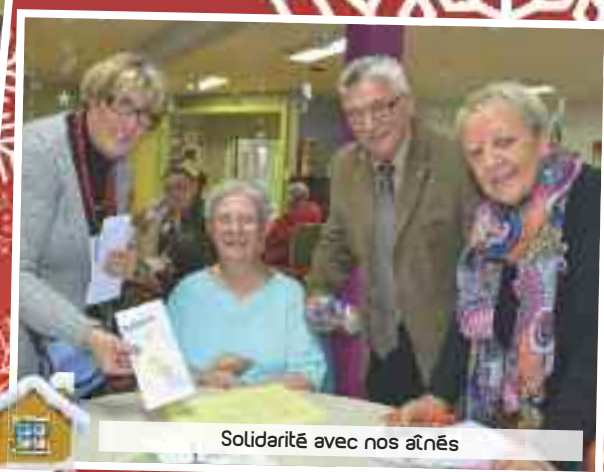
Solidarité avec nos aînés