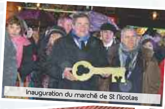
Inauguration du marché de St Nicolas