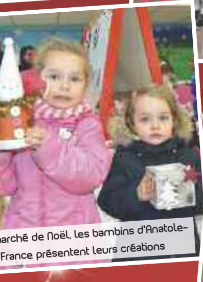
Marché de Noël, les bambins d'Anatole-France présentent leurs créations