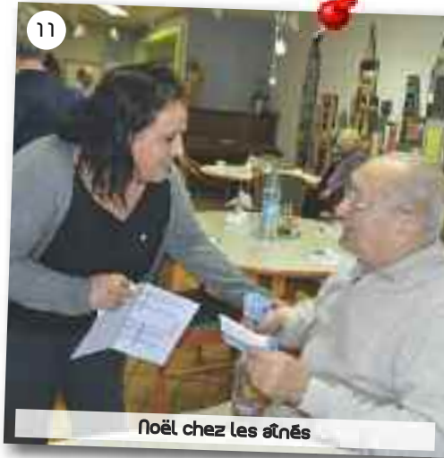
Noël chez les aînés