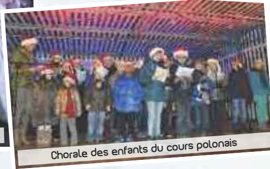
Chorale des enfants du cours polonais