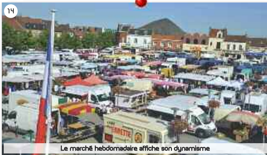
Le marché hebdomadaire affiche son dynamisme