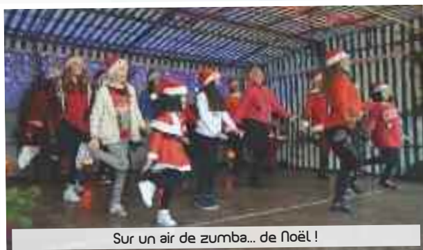
Sur un air de zumba... de Noël !