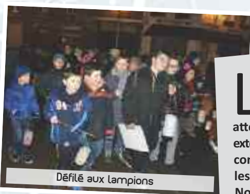
Défilé aux lampions