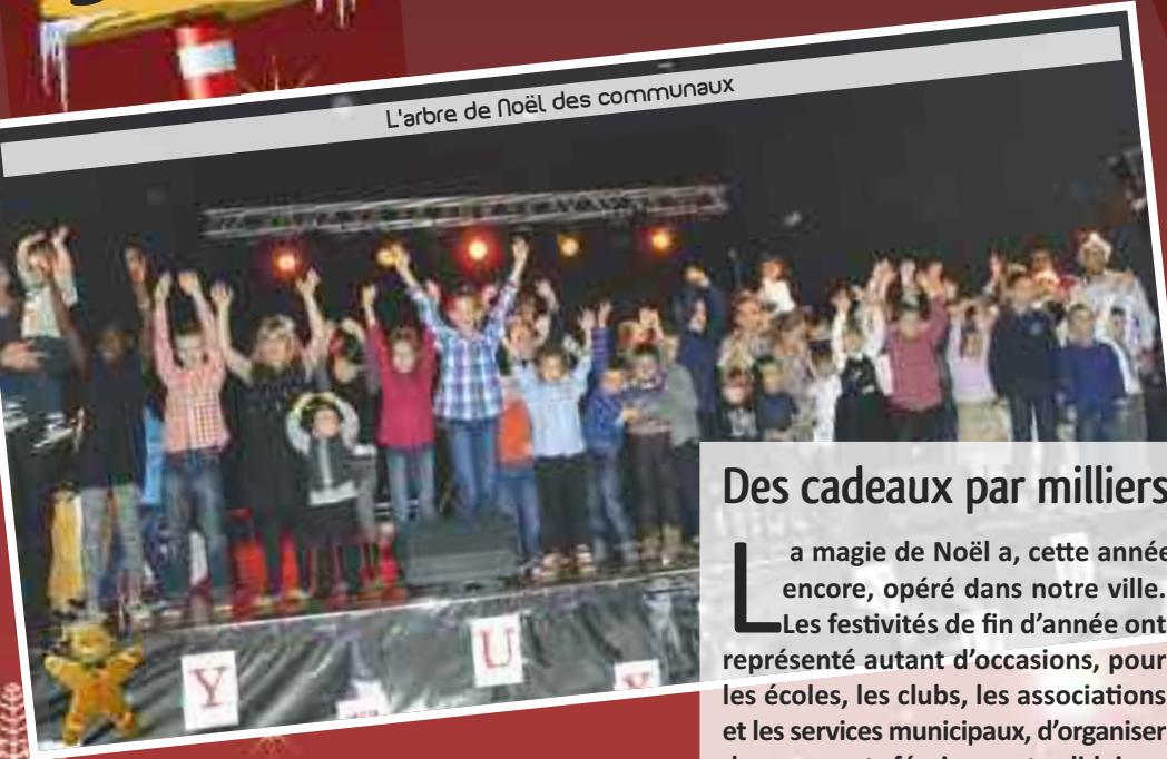
L'arbre de Noël des communaux