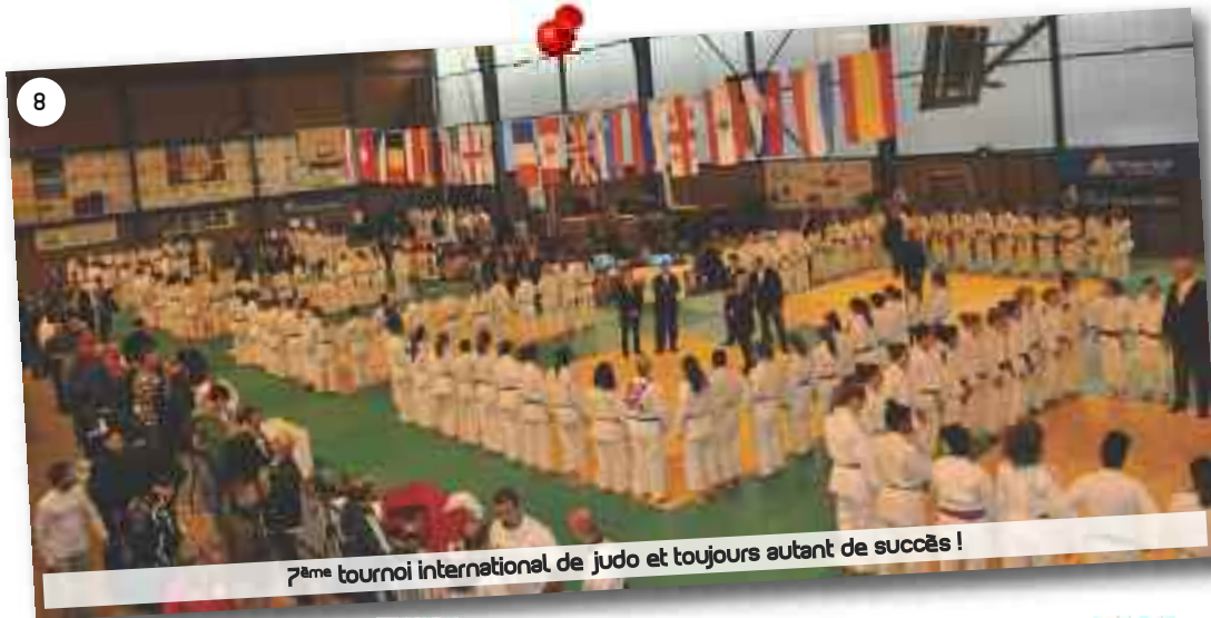
7 ème tournoi international de judo et toujours autant de succès !