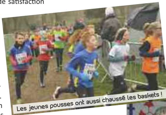
Les jeunes pousses ont aussi chaussé les baskets !