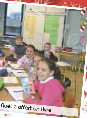
Noël a offert un livre