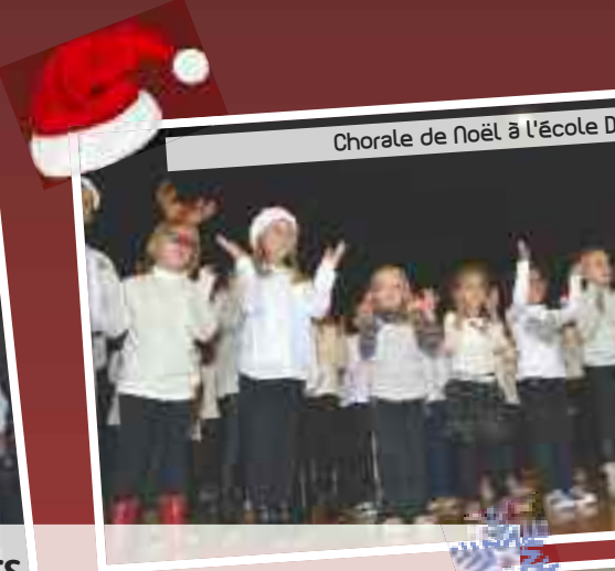
Chorale de Noël à l'école D

Des célébrations qui se sont poursuivies jusqu'à la fin du mois, pour le bonheur de tous !