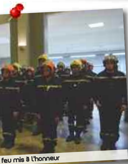
Le feu mis à l'honneur