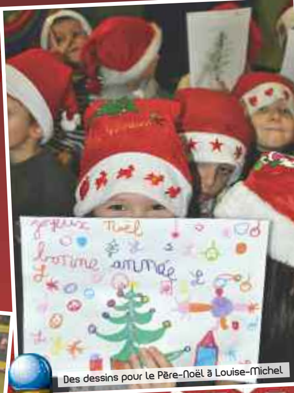
Des dessins pour Le Père-Noël à Louise-Michel