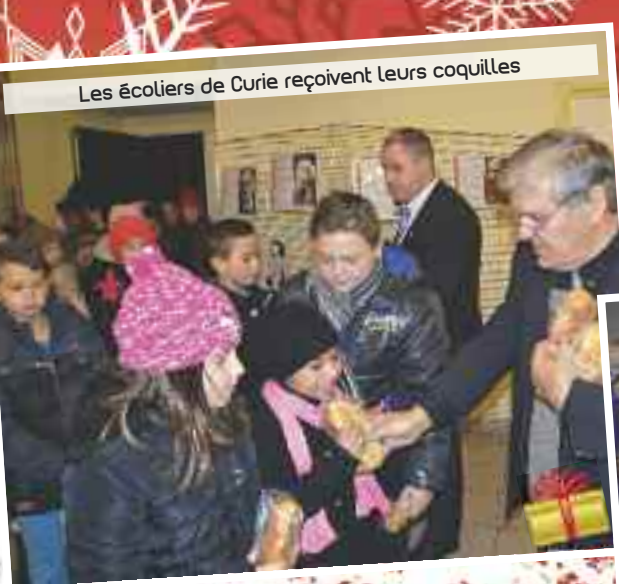
Les écoliers de Curie reçoivent leurs coquilles