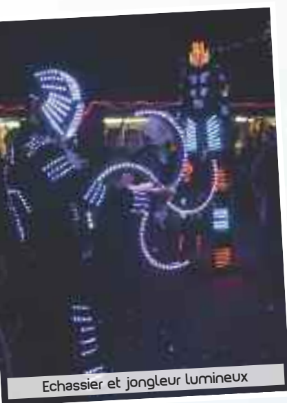
Echassier et jongleur lumineux