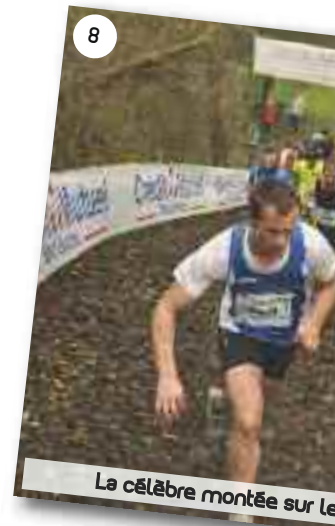
La célèbre montée sur Le