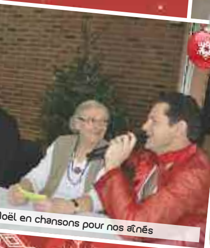
Noël en chansons pour nos aînés