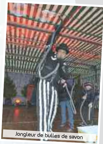
Jongleur de bulles de savon