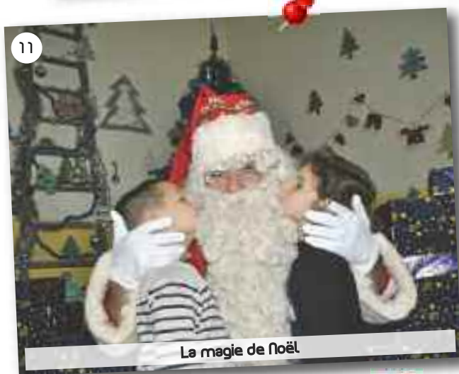
La magie de Noël