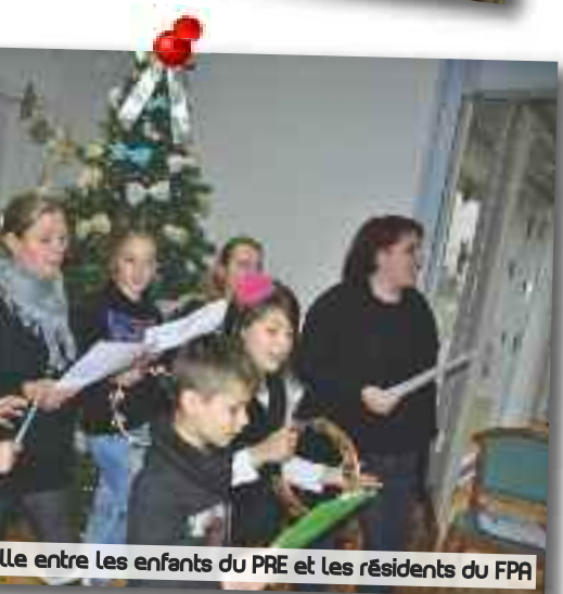
Le jeu entre les enfants du PRE et les résidents du FPA