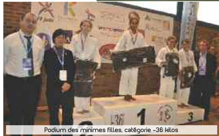
Podium des minimes filles, catégorie -36 kilos