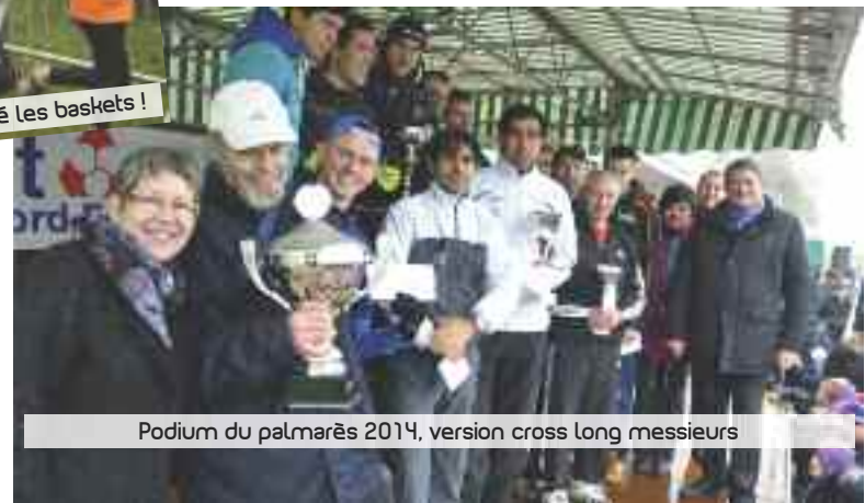
Podium du palmarès 2014, version cross long messieurs