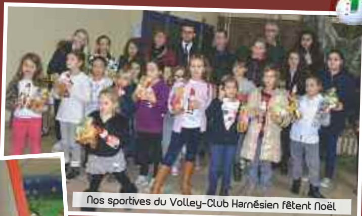
Nos sportives du Volley-Club Harnésien fêtent Noël