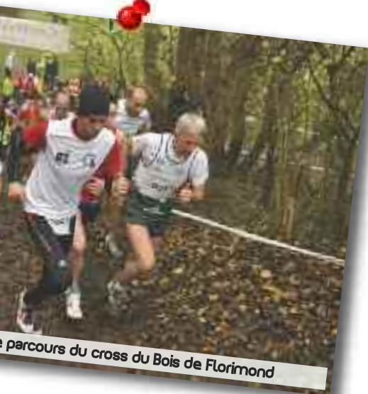
Le parcours du cross du Bois de Florimond

Vice-Président de la Communauté d'Agglomération de Lens-Liévin