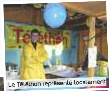
Le Téléthon représenté localement