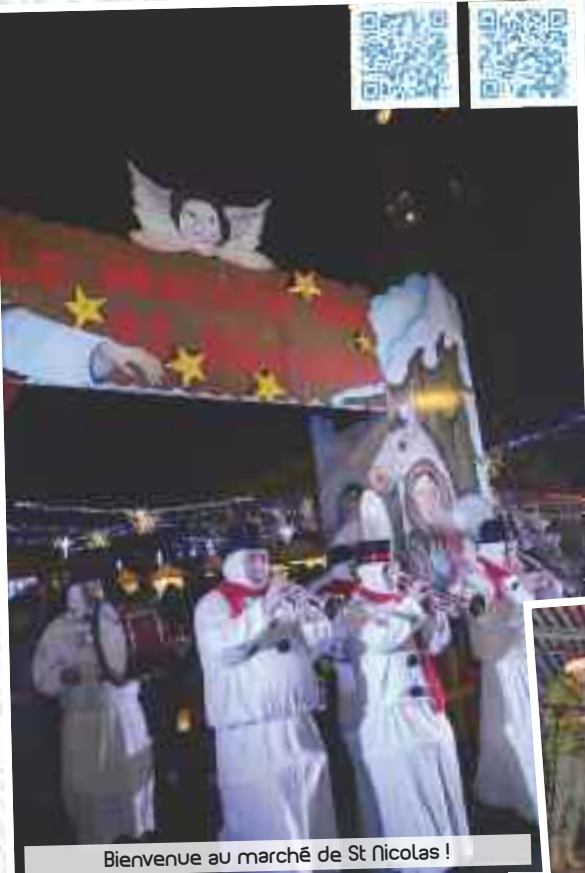
Bienvenue au marché de St Nicolas !