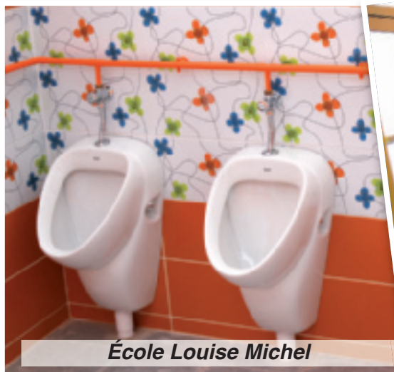
École Louise Michel

Un chantier mineur pour un enjeu majeur. Les débords de toiture des établissements et restaurants scolaires menaçaient de tomber. Mieux vaut prévenir que guérir. Le pôle travaux de la mairie a fait de ce chantier une des priorités de la municipalité.