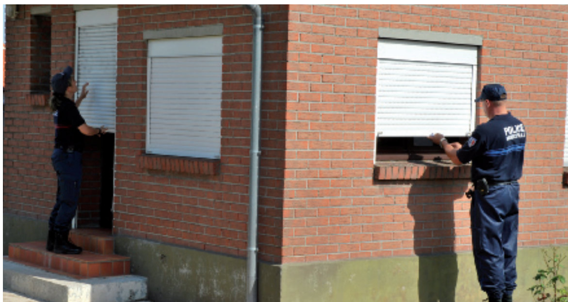
Les policiers municipaux vérifient qu'il n'y a pas eu de vandalisme

surveillance de votre domicile par la Police Municipale, il vous suffit de compléter suffisamment tôt le formulaire disponible à l'accueil de la mairie et sur notre site internet, rubrique « Cadre de vie - Vacances tranquilles », ou aller directement au poste. Vous pouvez également contacter la Police Municipale par téléphone au 03 91 84 00 90 ou par mail : police.municipale@ville-harnes.fr