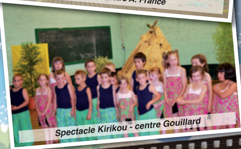
Spectacle Kirikou - centre Gouillard