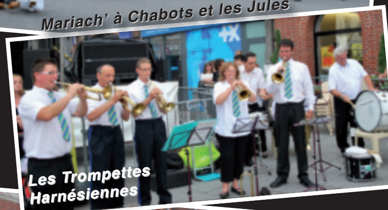
Les Trompettes Harnésiennes