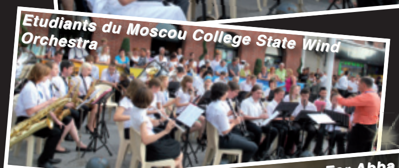
Etudiants du Moscou College State Wind Orchestra