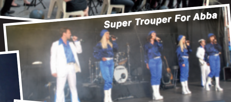
Super Troupers For Abba