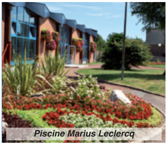
Piscine Marius Leclercq

Les différents massifs et parterres disposés çà et là, ainsi que le fleurissement aérien, apportent des couleurs dans la cité. Les zones boisées et verdoyantes couvrent approximativement 12% de la surface communale, soit environ 130 Ha.