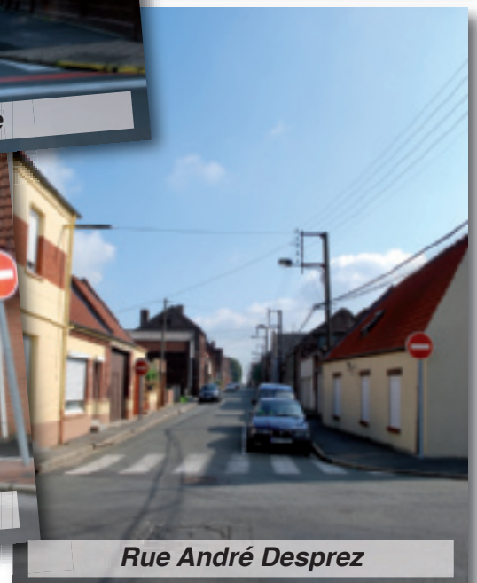
Rue André Desprez

La date de notre prochain Conseil municipal vous sera communiquée ultérieurement.