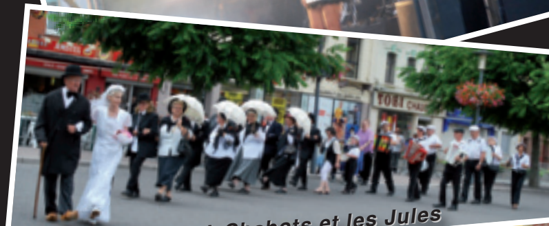
Mariach' à Chabots et les Jules