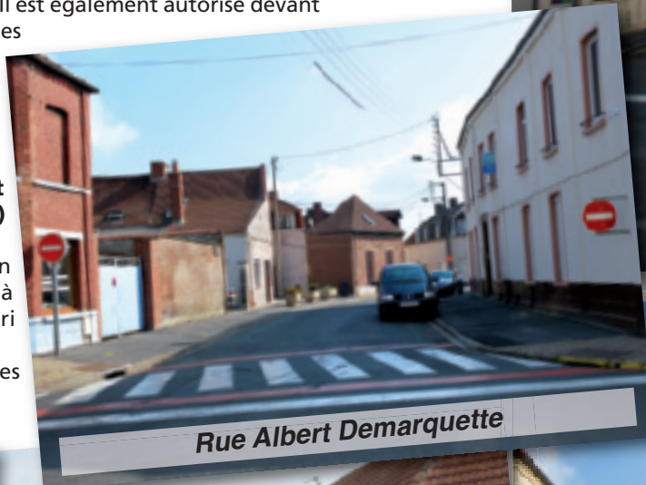
Rue Albert Demarquette