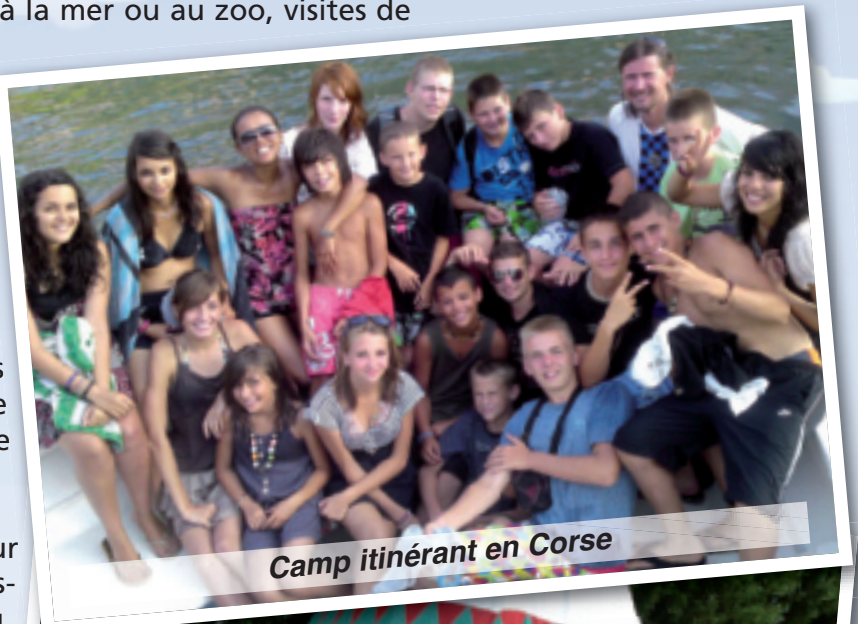
Camp itinérant en Corse

Des vacances estivales riches en souvenirs pour entamer du bon pied une nouvelle année scolaire.