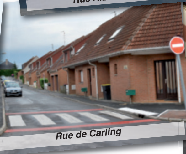
Rue de Carling