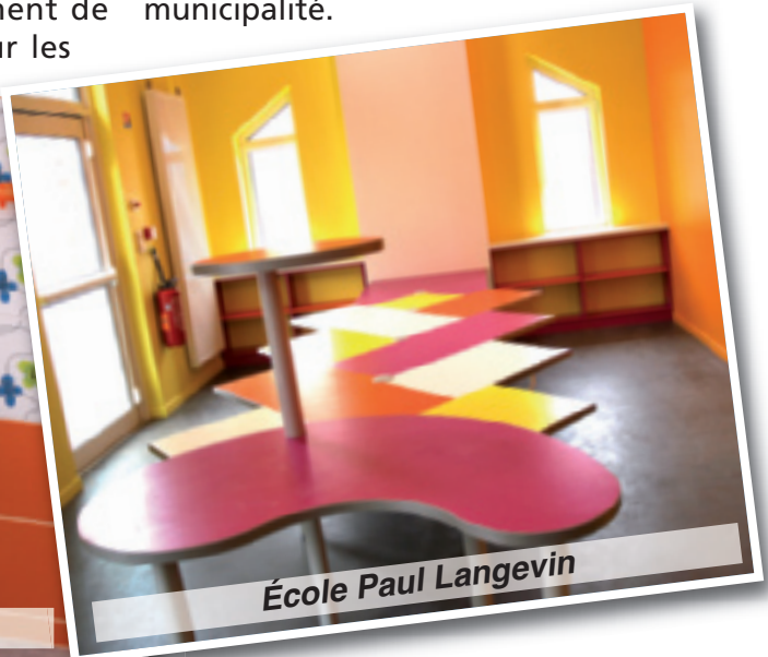
École Paul Langevin