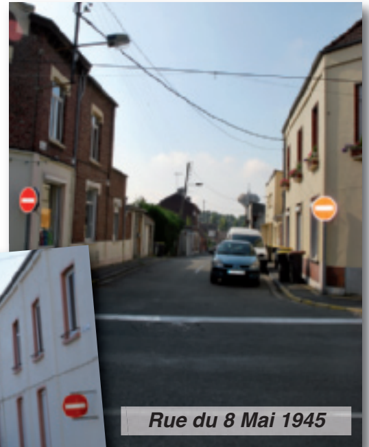
Rue du 8 Mai 1945

Le stationnement est autorisé côté pair et impair dans les stalles matérialisées au sol.