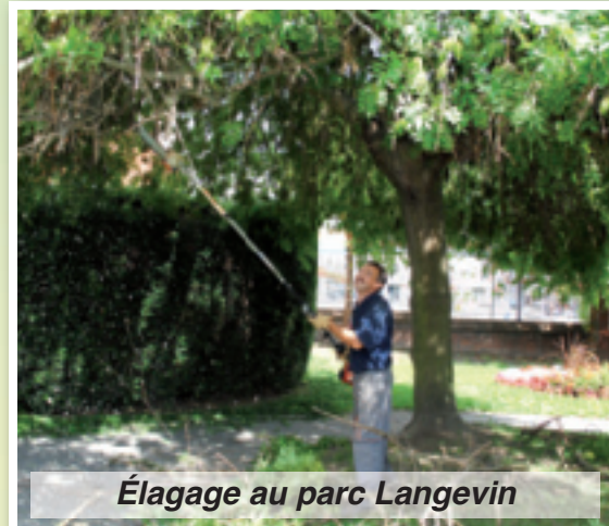
Élagage au parc Langevin

Fin août, ils procèdent à l'élagage des arbres et arbustes aux abords des établissements scolaires. Avec l'arrivée de l'automne et de l'hiver, le travail de nos dix agents n'en est pas moins terminé. C'est la période des feuilles mortes qu'il faut ramasser dans les écoles et espaces publics, du nettoyage et du bêchage des parterres et massifs, mais aussi celle des plantations d'arbustes et de fleurs à bulbes de printemps comme la tulipe.