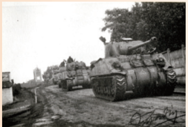
Un détour par Wingles, 2 septembre 1944. Une colonne de tanks anglais vont rejoindre Carvin et Lille en passant à l'ouest du « Pont Maudit »