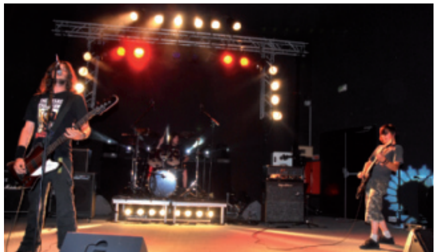
Black Dog Pride

Les jeunes fans et autres amateurs sont venus en nombre pour encourager les artistes. Un plaisir également partagé avec quelques curieux.