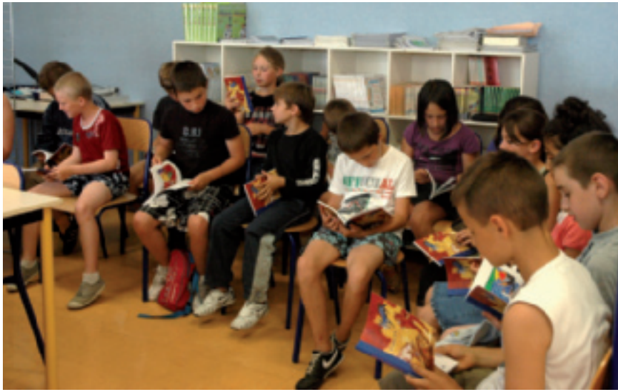
Heureux de leur cadeau, les élèves commencent à feuilleter leur livre

Ce cadeau intervient dans le cadre du plan de prévention de l'illettrisme, visant à offrir à chaque élève de CM1, avant les vacances, une œuvre littéraire.