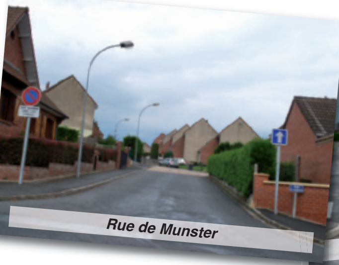
Rue de Munster