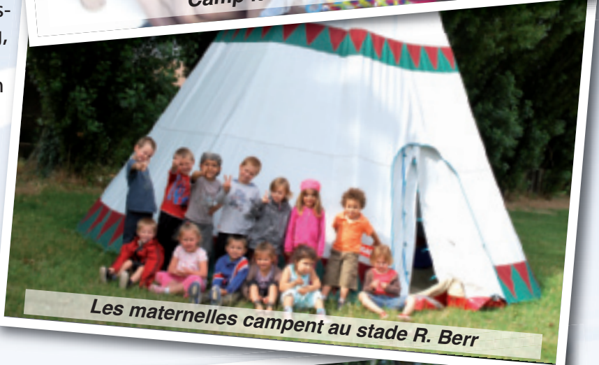
Les maternelles campent au stade R. Berr