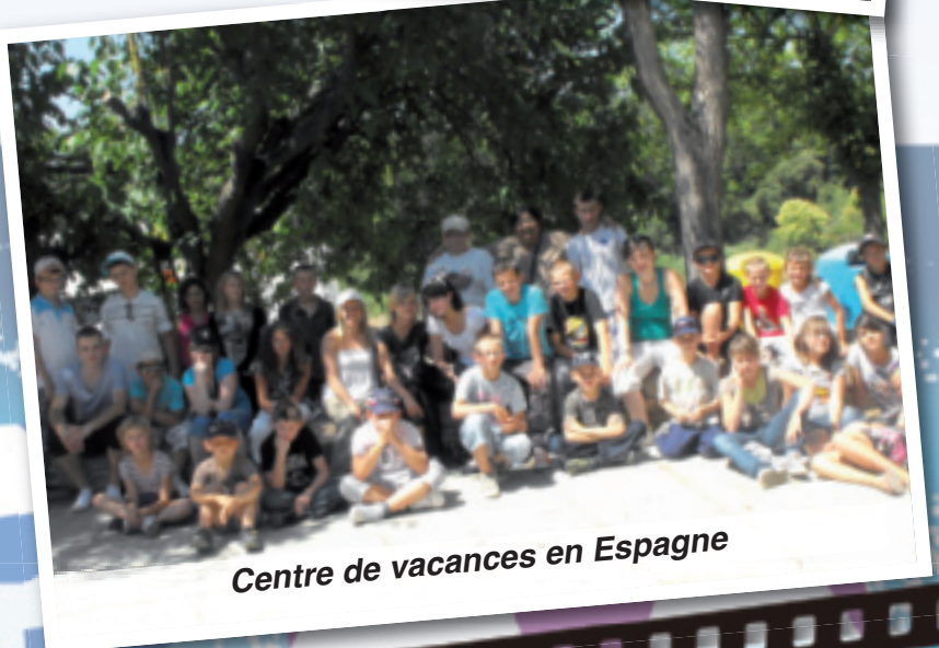
Centre de vacances en Espagne