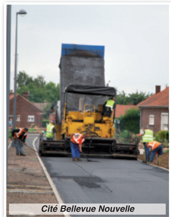
Cité Bellevue Nouvelle

Cité Bellevue, place à l'esthétisme. Les travaux d'effacement des réseaux ont débuté en novembre 2008 et se sont achevés fin août par les enrobés des trottoirs et chaussées. Rues Moulin Pépin, Emile Zola et des Ormeaux, les travaux d'assainissement, financés par la CALL (Communauté d'Agglomération de Lens-Liévin), ont commencé début août. A la mi-juillet, le renouvellement du revêtement routier de la rue des Fusillés, entre la rue du Maréchal Leclerc et le rond-point du Moulin, n'a pas échappé aux usagers de la route et aux riverains. N'oublions pas les travaux d'entretien réguliers réalisés tout au long de l'année. Nos experts guettent le moindre nid-de-poule et dysfonctionnement de l'éclairage public. Les services techniques interviennent également pour la rénovation du marquage de la signalisation routière et dans les écoles.