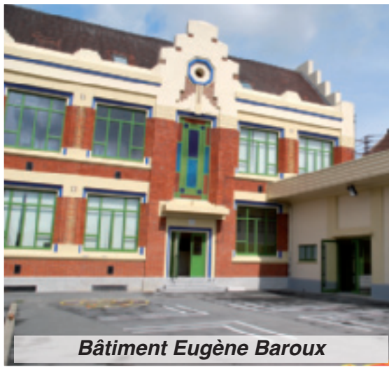
Bâtiment Eugène Baroux

Dès la rentrée, les C.P. et leurs enseignants auront une zone protégée sous laquelle ils pourront s'abriter les jours d'intempérie. De la toiture à l'aménagement intérieur, le préau a été refait à neuf. Le sol, qui n'était auparavant qu'une surface lisse en béton,