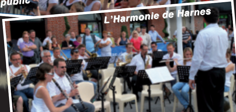
L'Harmonie de Harnes