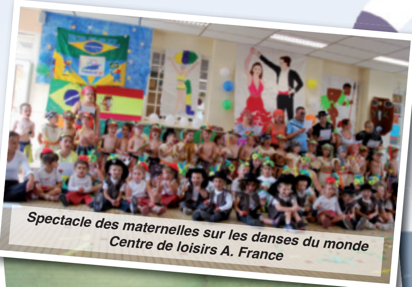
Spectacle des maternelles sur les danses du monde Centre de loisirs A. France