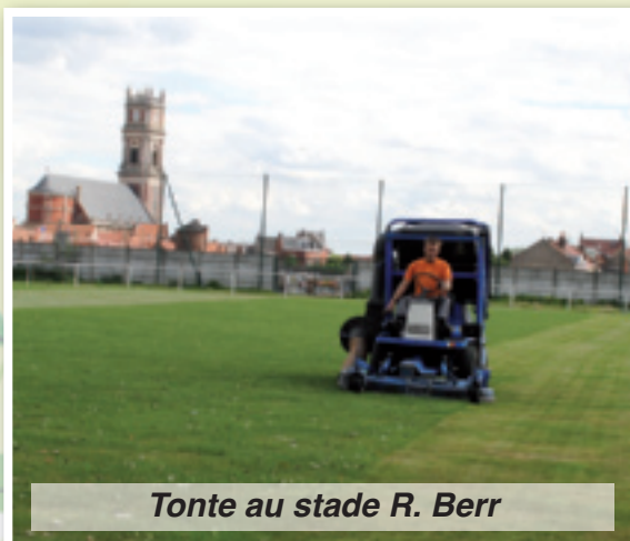
Tonte au stade R. Berr

Dès le mois de juin, les «agents verts» arrosent les massifs et suspensions tous les deux jours en moyenne, et ce jusqu'en septembre. Le désherbage des parterres et des 50 km de fil d'eau ainsi que la tonte des pelouses occupent une partie de leurs journées l'été. Cela couvre les quatre terrains de football des différents stades, les espaces verts au niveau du complexe sportif André Bigotte, le parc du musée municipal, celui du CCAS et le Bois de Florimond.