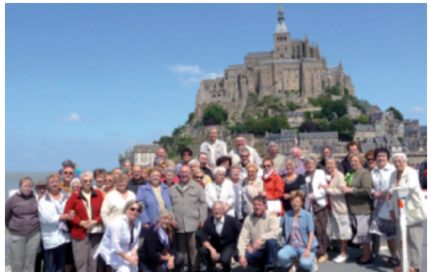
Photo souvenir au pied du Mont Saint-Michel

Tout était réuni pour la réussite de ce séjour. Rendez-vous est donné l'année prochaine pour découvrir une autre région de France.