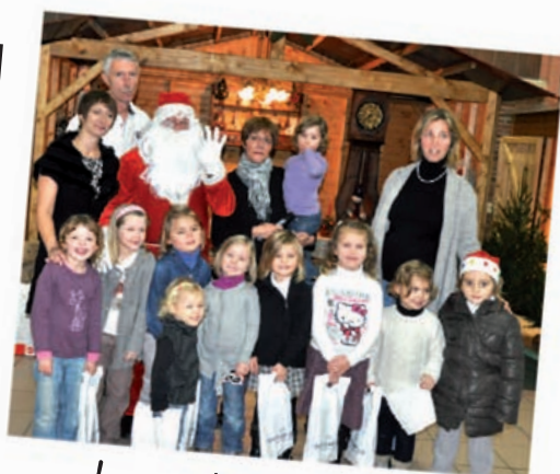
Joyeux Noël au V.C.H