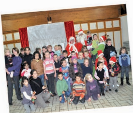
Au quartier de la Gaillette