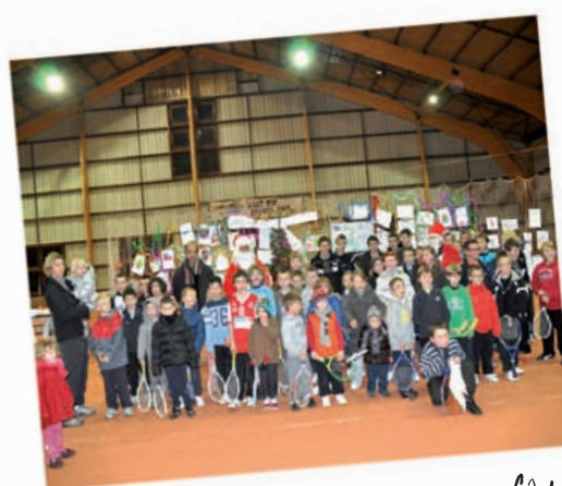
Le Tennis Club de Harnes en fête !