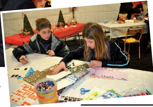
Préparation des lampions par les enfants, dans le stand «Harnes, C'est Vous !»

rousel, surtout s'ils avaient en leur possession les tickets offerts gracieusement par la municipalité. Saint-Nicolas, conforta-