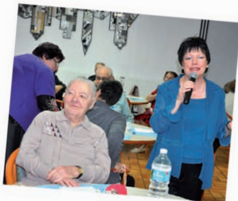
Chez les résidents du F.P.A