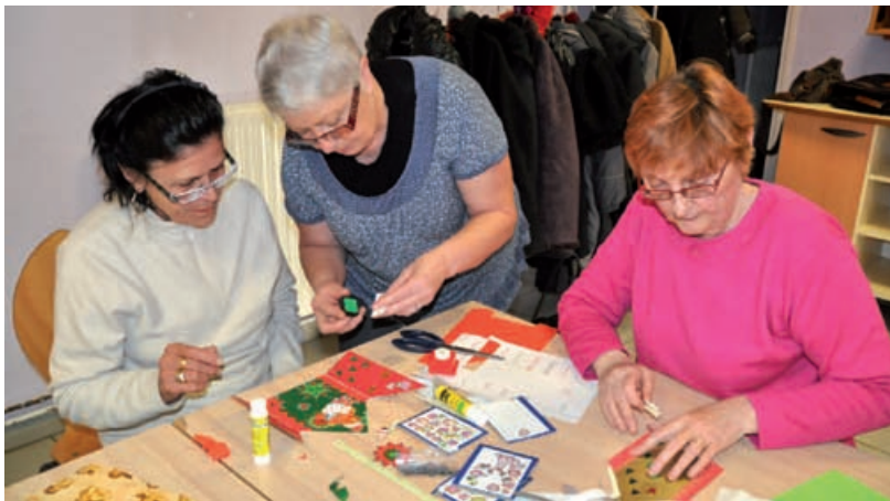
Réalisations sur le thème de Noël

Depuis le 13 décembre, une nouvelle activité est venue gonfler les rangs de celles déjà proposées par la Retraite Sportive de la Gohelle (RSG).