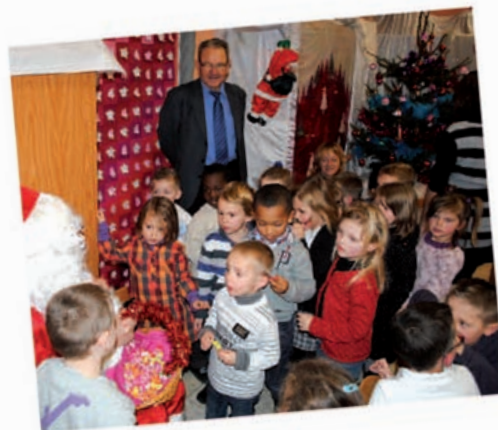
Le Père Noël à Langevin