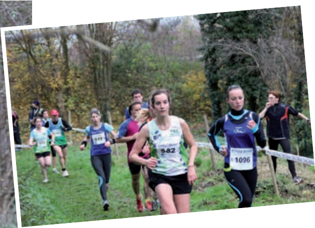
Les participants du cross court

C omme à l'accoutumée, nombreux ont été les coureurs à rejoindre l'appel du Jogging-Club Harnésien. Le dernier dimanche de novembre, les bénévoles organisaient la 15 ème édition du cross-country au Bois de Florimond.