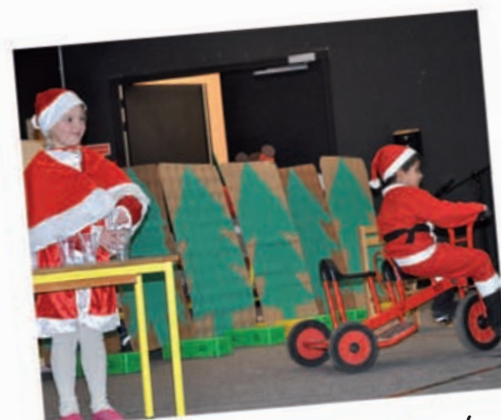
Spectacle de l'école Zola