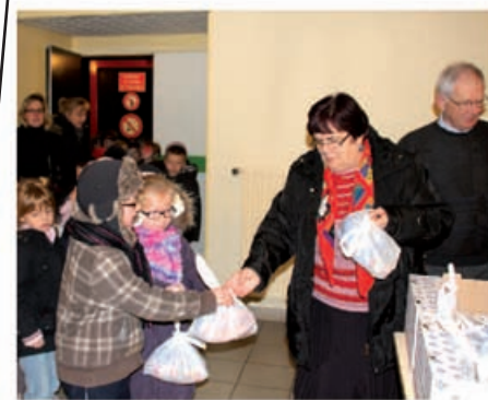
Distribution de friandises aux écoliers de Jaurès