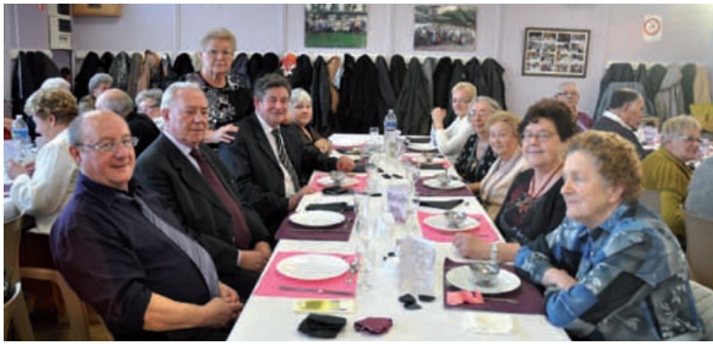
Le Club du 3 ème âge de la cité d'Orient célèbre la Sainte Barbe