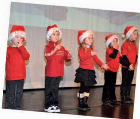
Les chants de Noël à Barbusse