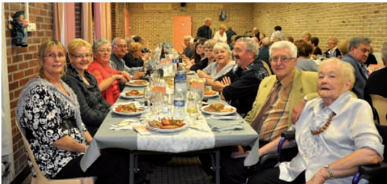
Ambiance festive au Club du Grand Moulin

Les 1 er et 4 décembre marquent respectivement les fêtes de la Saint Eloi, patron des orfèvres, et de la Sainte Barbe, protectrice des mineurs. Ces deux journées sont l'occasion, pour les membres de plusieurs associations harnésiennes, de se réunir lors de banquets.