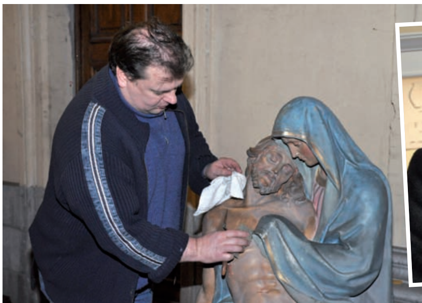
L'artiste peintre au travail