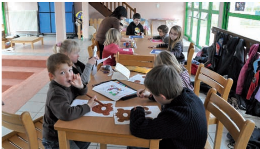
Confection de cadeaux de Noël

C haque période de vacances est l'occasion, pour le centre de loisirs sans hébergement H. Guillard, d'ouvrir ses portes et d'accueillir bon nombre d'enfants. Celle de Noël n'a pas dérogé à cette tradition.