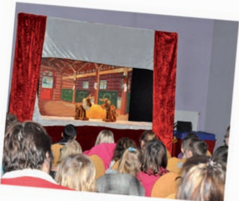
Spectacle au quartier des Sources