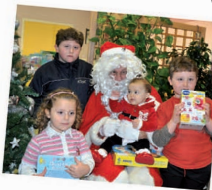
Le Noël du CCAS