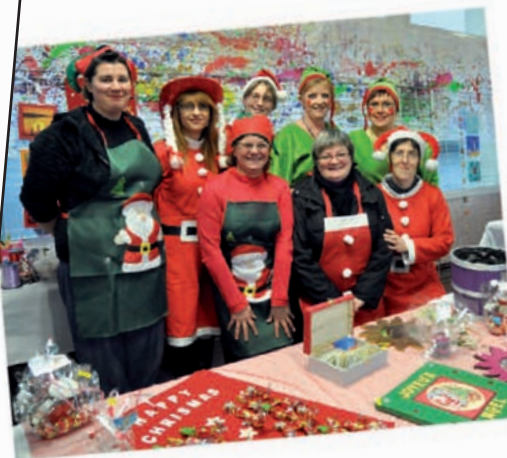
Marché de Noël à l'école Curie