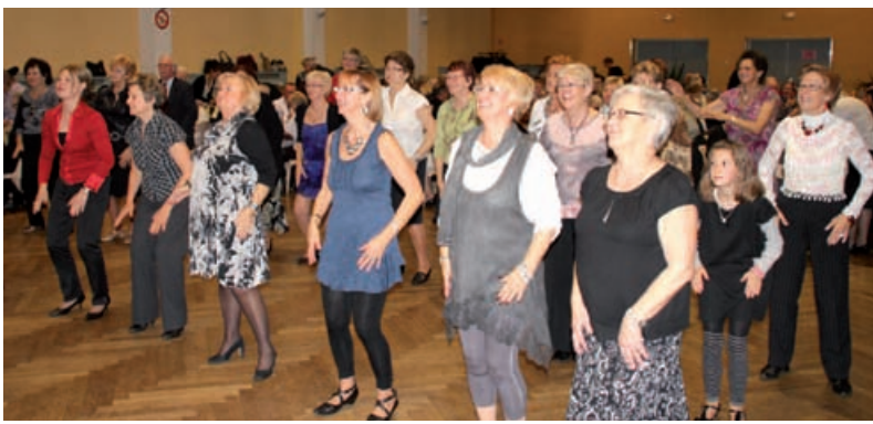
Les Médaillés du Travail sur la piste de danse