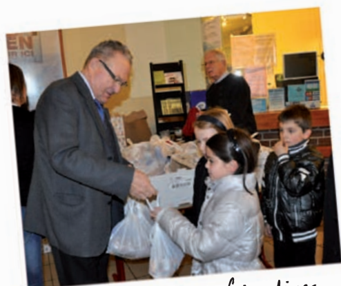
Distribution de friandises aux enfants de Diderot