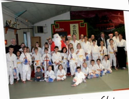
Le Noël de l'Aïkido Club