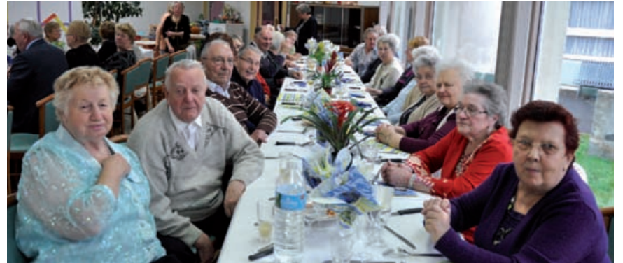
Du côté du Foyer A. Croizat