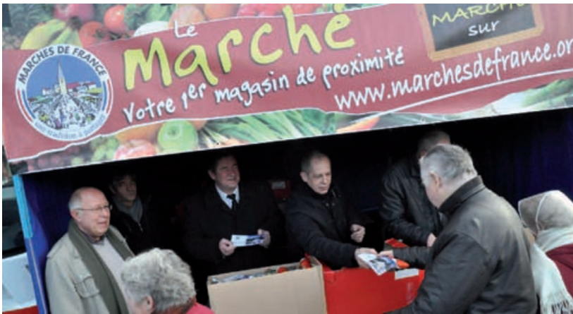
Les clients étaient nombreux à être attirés par le stand

J udi 22 décembre, le syndicat lensois des commerçants non-sédentaires et la municipalité, étaient réunis sur le marché, à l'occasion des fêtes de fin d'année.