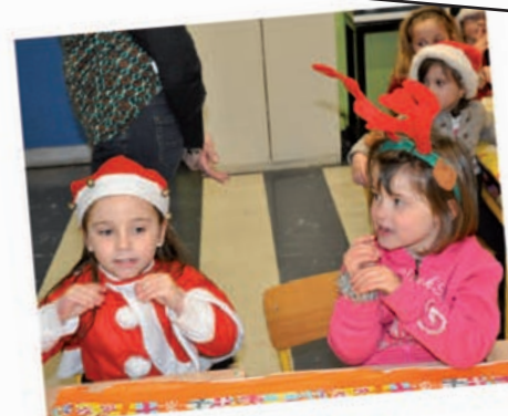
On se déguise à Louise Michel