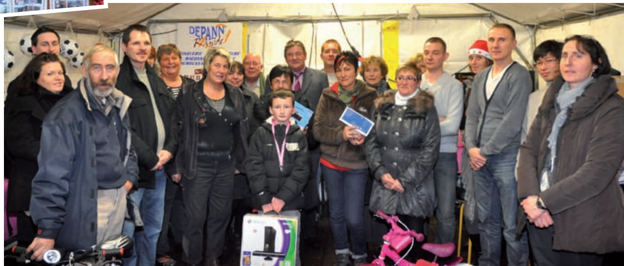
Remise des gros lots de l'UCAH aux gagnants, suite au jeu-concours