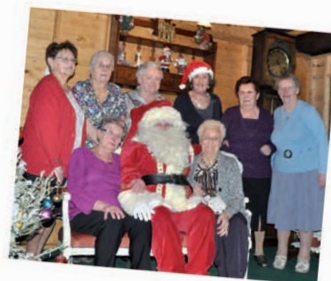
Le Noël du bel âge