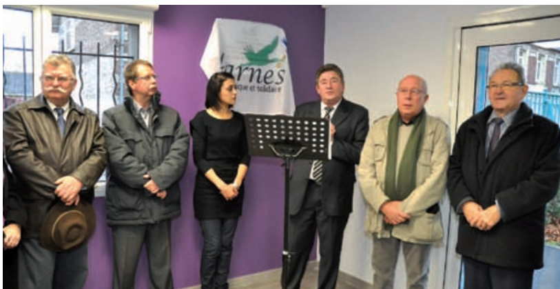
Un lancement réussi

jets. Le Service d'Aide à la Vie Associative (S.A.V.A.), le Fonds de Participation des Habitants (F.P.H.) et le Pôle Citoyenneté accueillent les associations et le public exclusivement le vendredi matin de 8h30 à 12h en mairie (2 ème étage), ainsi que les mercredi et vendredi de 13h30 à 17h à la MIC. Cette dernière est ouverte du mardi au vendredi de 10h à 12h et de 13h30 à 19h, le samedi de 14h à 19h. Fermée le lundi.