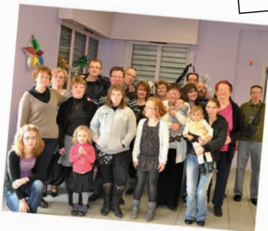
Les Trompettes Harnésiennes