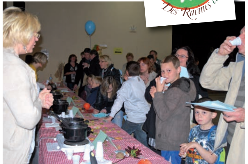
Concours et dégustation de soupe