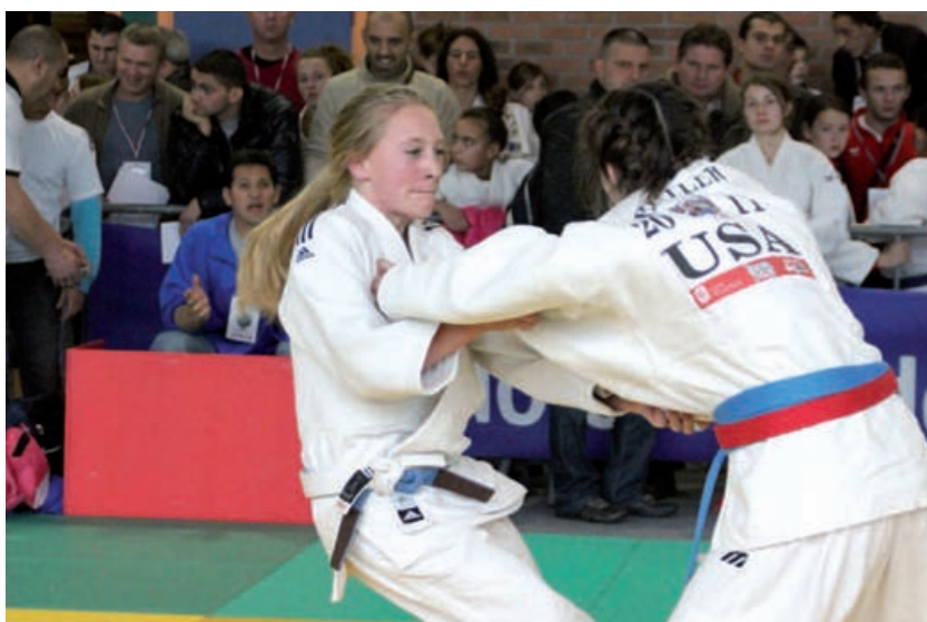
Combat des minimes filles