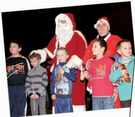
Du côté de l'UASH

plus 80 ans ainsi que les adultes bénéficiant de l'AAH se sont vus remettre des chèques-cadeaux par les élus et les employés du CCAS.