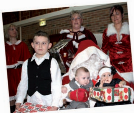
Arbre de Noël des communaux