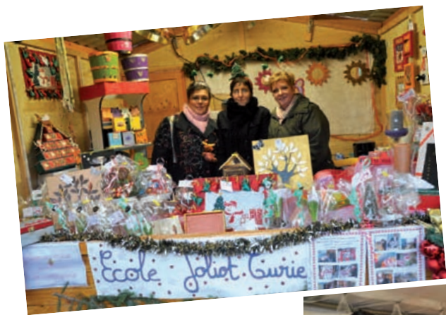
Les parents de l'École Joliot Curie occupaient eux aussi un chalet, afin de récolter des fonds et financer une activité pour les enfants

Une recette bien rodée qui demeure un grand moment de la vie harnésienne. Le rendez-vous est d'ores et déjà donné à l'année prochaine.