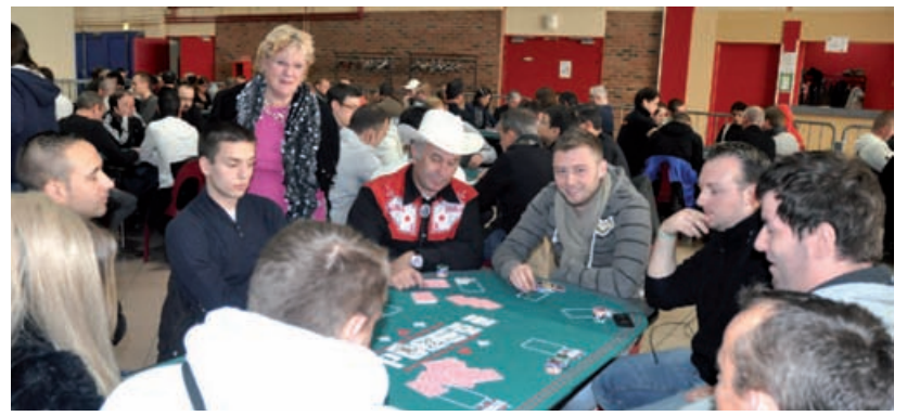
De la concentration et de la bonne humeur