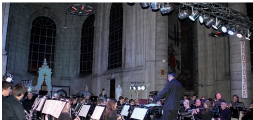
Un moment magique !

L'Harmonie fêtera son 150 ème anniversaire en 2012. Pour l'occasion, elle nous réserve un programme tout aussi riche que varié. Elle accompagnera notamment les 200 choristes du Chœur Régional du Nord-Pas-de-Calais le 24 juin au complexe sportif A. Bigotte. Une superbe fête se prépare !