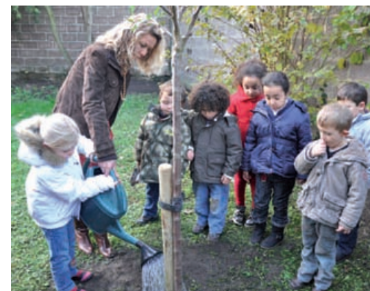
Nos écoliers ont la main verte

naturelles. Les agents avaient également préparé une bande de terre destinée aux petites plantations. Un projet pédagogique développé en parallèle à l'action « Des Racines et des Hommes 2012 ».